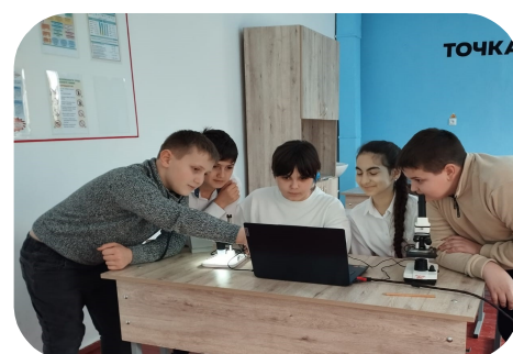
Групповая работа над проектом