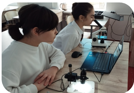
ученицы 5 класса изучают строение растительной клетки

На базе Центра «Точка роста», в кабинете биологии и химии проведено очередное занятие дополнительного образования кружка «Мир вокруг нас». Занятие проведено в форме практической работы с использованием оборудования «Точки роста», а именно микроскопом и лупы. Обучающиеся рассмотрели микропрепараты представителей флоры и фауны Моздокского района. Научились работать с объектами живой природы, изучая передвижения насекомых и червей. Закрепили знания по теме «Устройство микроскопа и правила работы с ним»